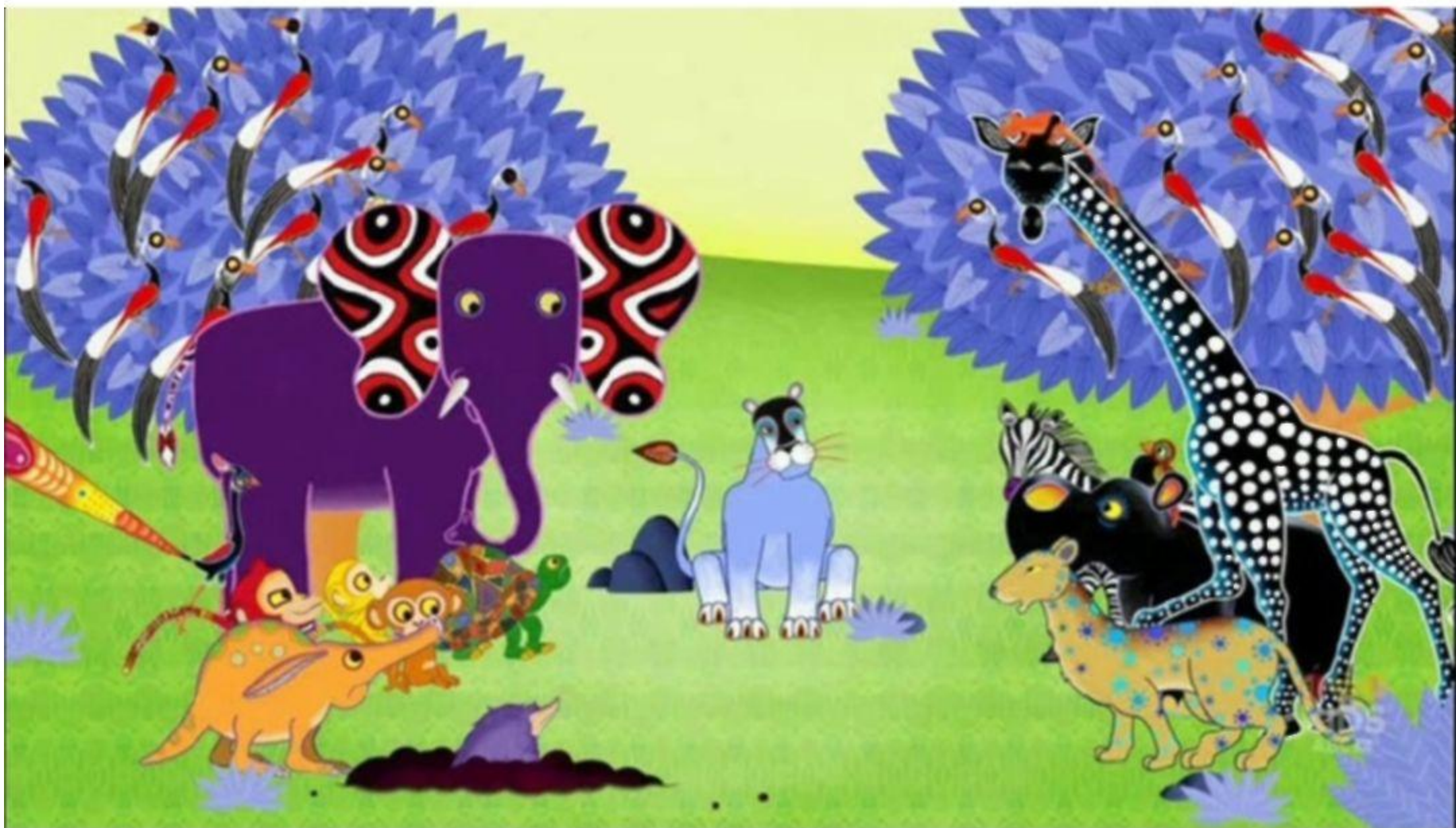
Кадр из мультсериала Tinga Tinga Tales

В настоящее время стиль Тингатинга активно развивается и пользуется популярностью во всём мире, причём не только в изначальном варианте. В этом стиле, например, нарисован детский британо-кенийский мультсериал Tinga Tinga Tales, который знакомит детей с африканскими народными сказками. Выпускаются наборы открыток, марки, магниты и другие сувениры, которые охотно приобретают туристы и коллекционеры.