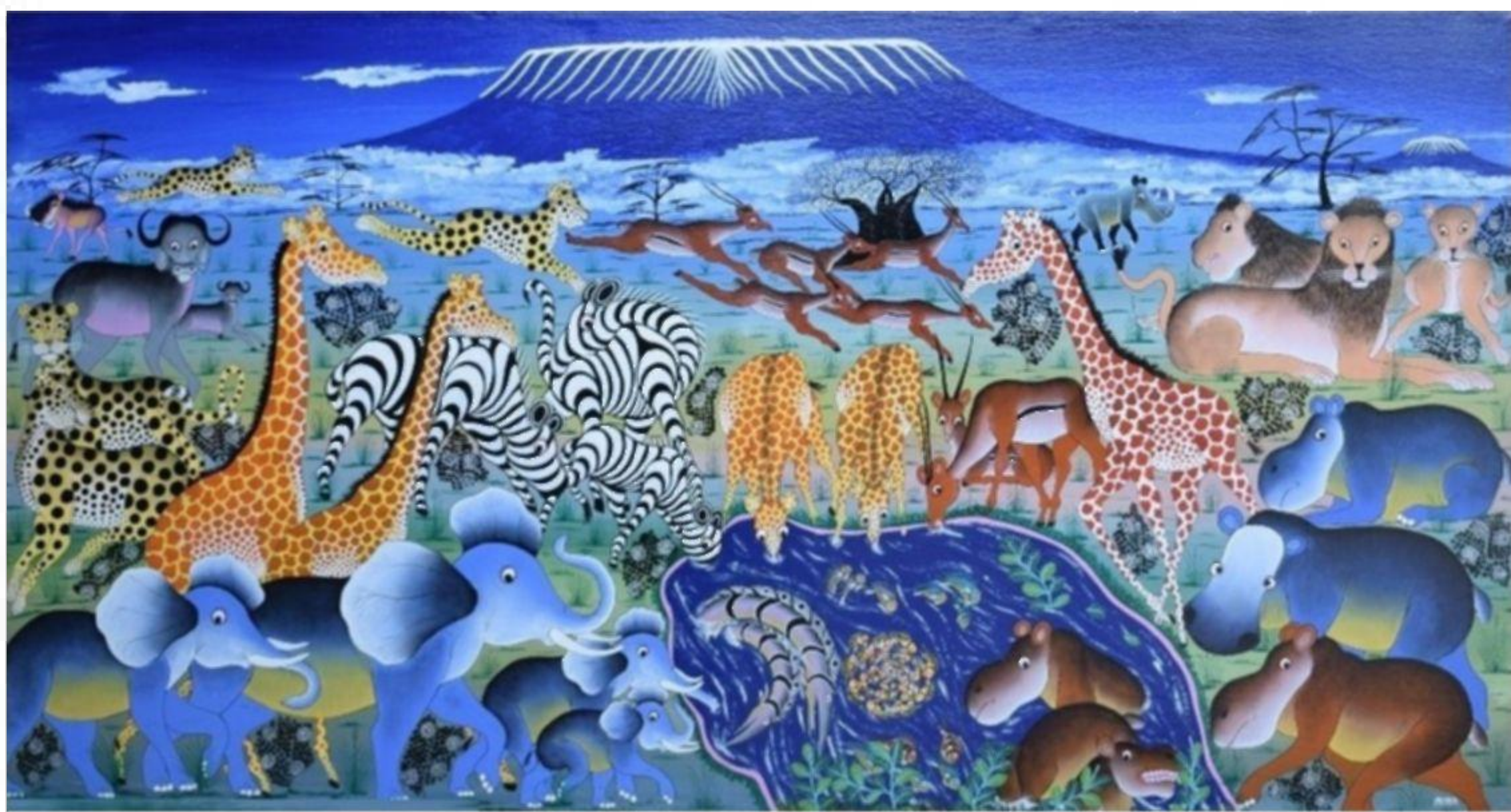
Современная композиция в стиле Тингатиинга